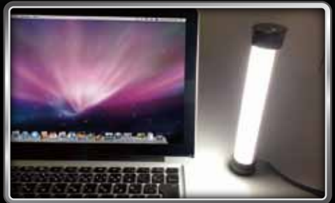
デスクランプとしても充分な明るさ

バーベキューやキャンプなどのレジャーから災害・緊急時に備える防災用まで、幅広いシーンで活躍します。