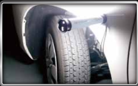
見にくい箇所もしっかり照らします