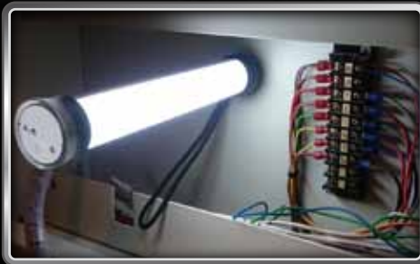
狭い吸着面でもしっかり固定